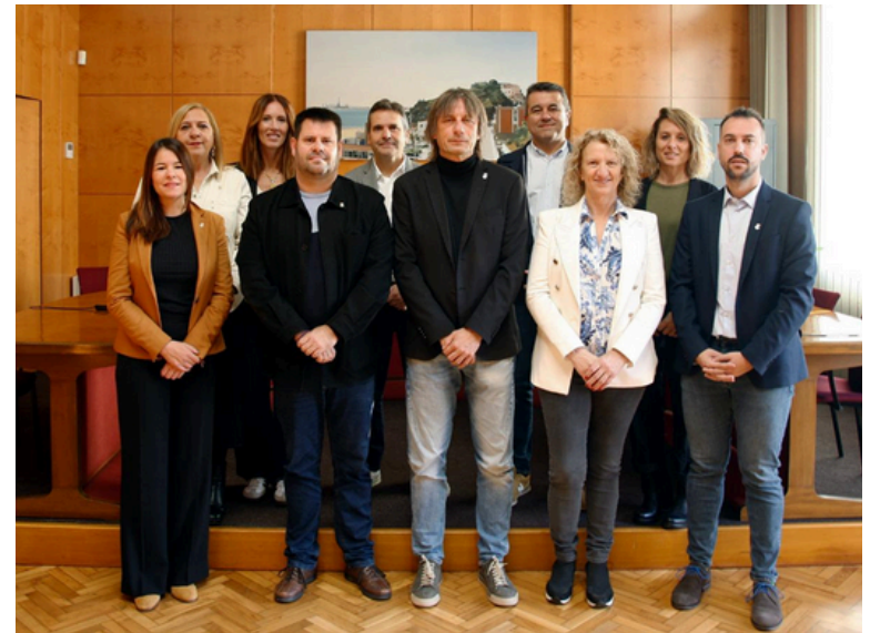
Equip de Govern de Montgat

Gràcies per la vostra confiança. Avancem junts cap a un Montgat millor.